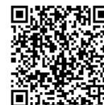
バスターミナル地図