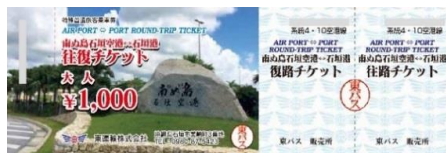
空港・港往復割引乗車券販売中